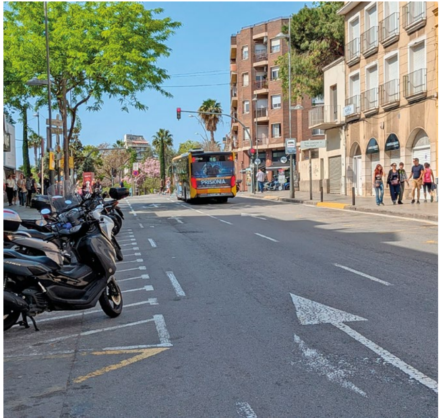
Via Augusta, zona de motos lado izquierdo estará el carril bus ¿taxi?

Supondrá también un cambio visual profundo.