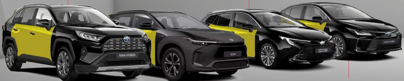
TOYOTA COROLLA SEDAN HYBRID