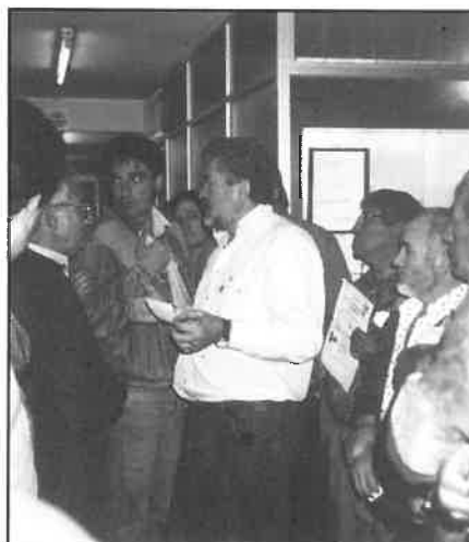
Muchos taxistas acudieron a la sede del Sindicato para conocer los resultados

Otros sindicatos se han presentado más que con programas con propuestas anti-STAC. La Asociación Empresarial mandó a sus afiliados