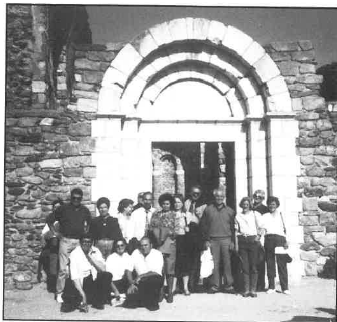
Ciutadella de Roses

De aquí nos trasladamos a Santa Margarita de Roses, donde nos estaban esperando en el restaurante con una copiosísima comida. Después de la sobremesa fuimos en autocar hasta la Ciutadella desde donde, después de visitarla, volvimos andando (para bajar la comida) por el Paseo Marítimo hasta el hotel, donde nos esperaba el autocar, saliendo a continuación hacia Barcelona, donde llegamos pasadas las 9.30 h de la noche, felices y contentos, después de haber pasado un día muy agradable.