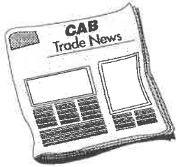
CAB Trade News

En el VI Congreso del Taxi Europeo se dio un toque de alerta sobre el tema de la violencia en las calles, y en especial el significativo aumento de asesinatos de taxistas en los últimos años. Por ejemplo, una gran ciudad como Londres no es ajena al intrusismo en un sector como el taxi. Sin embargo, cuando al intrusismo se le une el peligro de la propia vida, la cuestión adquiere una importancia de primer orden. Es por ello que los taxistas de Londres se unieron el pasado día 18 de enero a la campaña Tolerancia Cero contra la violencia que se llevó a cabo durante todo el mes de enero. Reproducimos aquí un fragmento de la noticia que abría la portada del periódico CAB Trade News el pasado 19 de enero.