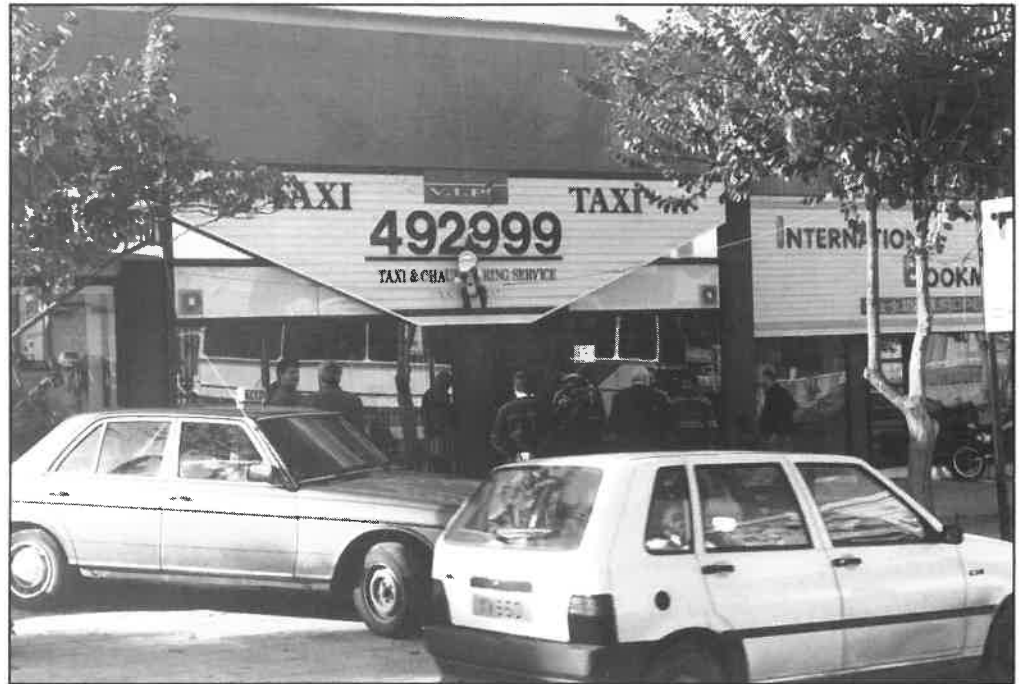
Visita a una cooperativa del taxi en Nicosia. Esta cooperativa estaba especializada en taxis de élite, es decir, en vehículos de alto standing con toda clase de comodidades en su interior

2. Se creía que la desregulación conllevaba un aumento de los beneficios económicos del taxi. Veamos los efectos reales siguientes: la productividad del sector ha bajado entre el 34% y el 48% en ciudades como: Seattle, Phoenix, Tucson, San Diego,