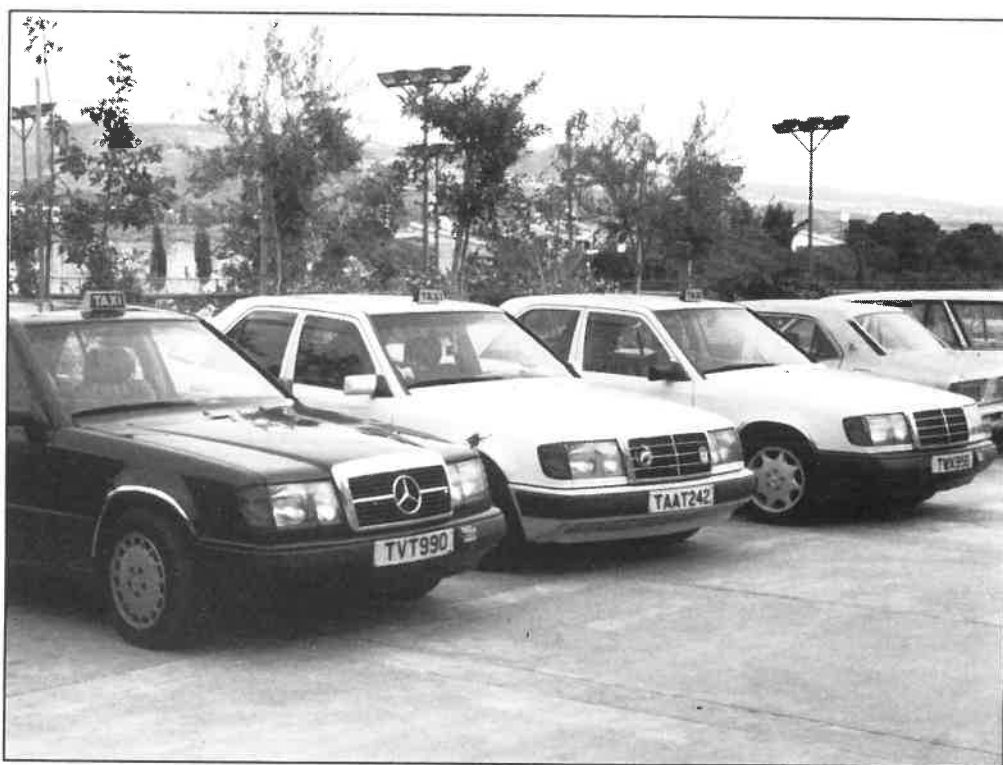
En Nicosia todos los taxis son Mercedes

El poder del mercado está estrechamente relacionado con las economías de escala, sin embargo, en el sector del taxi no parecen existir economías de escala (que permiten cargar precios más altos que el coste marginal de producción), y si existen, provocan