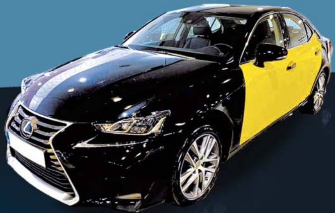
Lexus IS300H (híbrido)