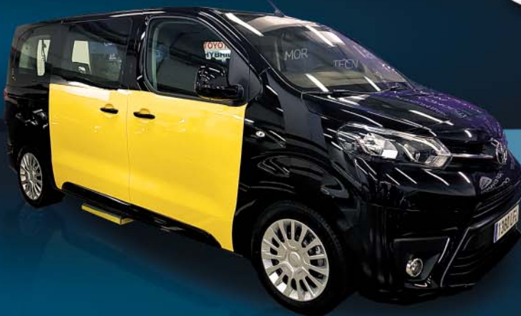
Toyota Proace Eurotaxi Bcn (diesel)