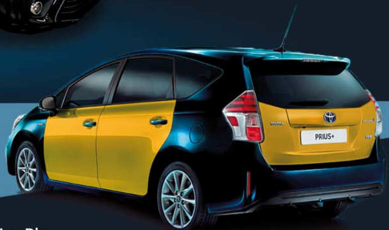
Toyota Prius Plus (híbrido)