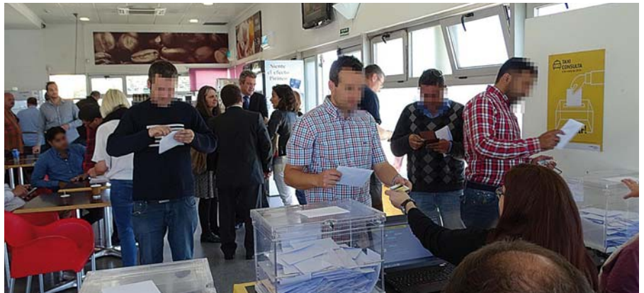
Taxistas votando en una consulta anterior.

Nuevamente, el sector del taxi del Área Metropolitana de Barcelona (AMB) está llamado a participar en una nueva consulta (elecciones) para configurar la nueva Taula Tècnica del Taxi (TTT), máximo órgano consultivo de la Administración con el colectivo donde se debaten los temas de nuestra industria. El papel de las organizaciones representativas es dar opinión y fijar su postura ante los temas que se planteen y a la vez trasladar las reivindicaciones de los taxistas. Por este motivo, es fundamental la MÁXIMA PARTICIPACIÓN DEL COLECTIVO .