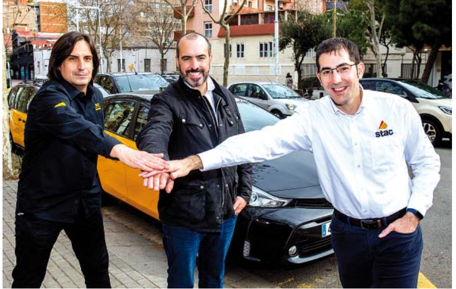
Los miembros de la candidatura que se presentan a la consulta por el STAC.

La verdad es que a mí me gusta mi trabajo y este sector me ha aportado mucho a nivel personal y profesional. Todo lo relacionado con el taxi me interesa y me gustaría seguir aquí hasta que me jubile. Estamos comprometidos con defender el valor patrimonial de nuestras licencias y el actual régimen jurídico, es decir, que el 95% de las licencias sigan en ma-